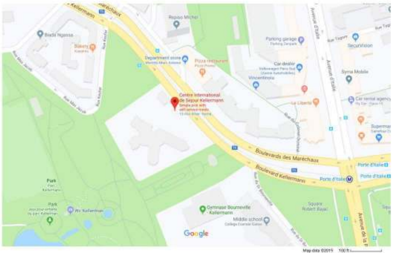
Centre International de Sejour Kellermann

For those not staying at the Hotel Kellermann, located at 17 Boulevard Kellermann, Paris 13, it may be easily reached by bus, metro, or Tramway stopping at the Porte d'Italie.