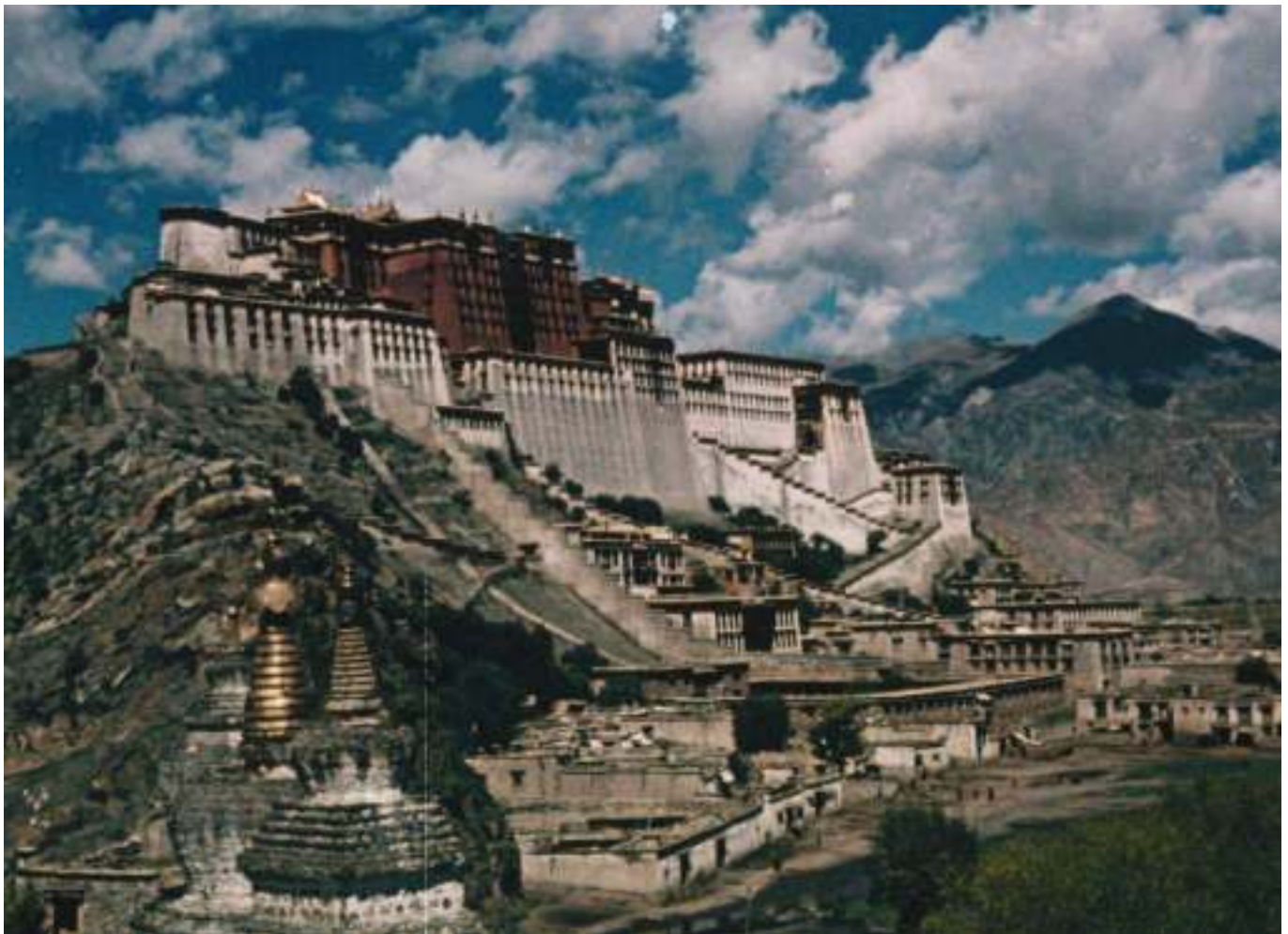
Potala Palace, still from the documentary film “On the Road through Tibet” (1956)

18:50 A discussion followed by the screening of “On the Road Through Tibet” (1956). For those who cannot attend this screening, additional projections will be held during the lunch breaks on Wednesday and Friday.