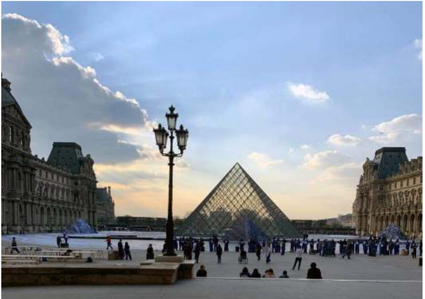
The late I. M. Pei's Pyramid in the courtyard of the Louvre Museum

https://iats2019.sciencesconf.org/resource/page/id/7