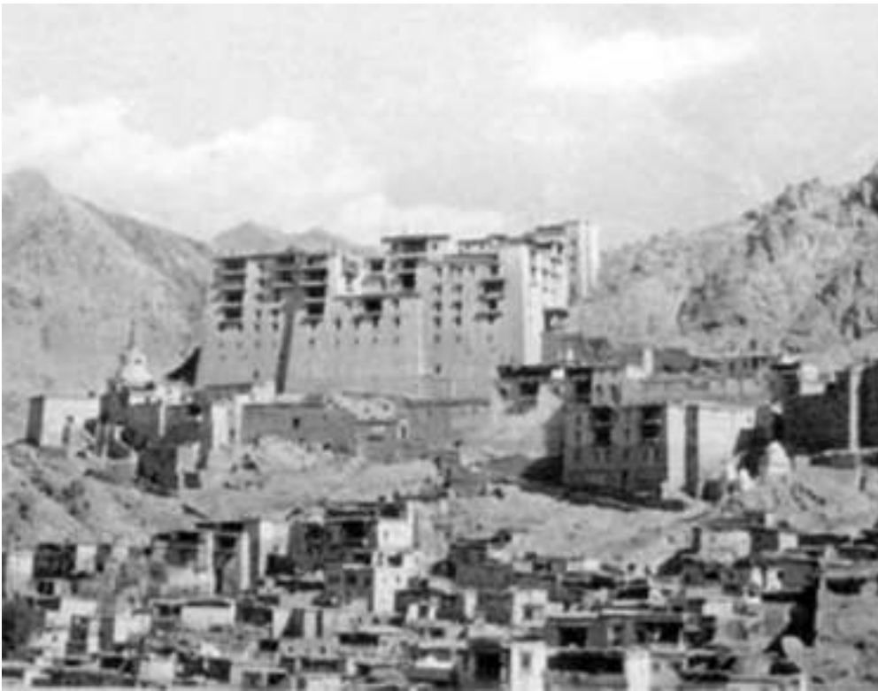
Historic View of Leh, Ladakh, before 1950 After André Alexander, Towards a Management Plan for the Old Town of Leh . Berlin 2007.